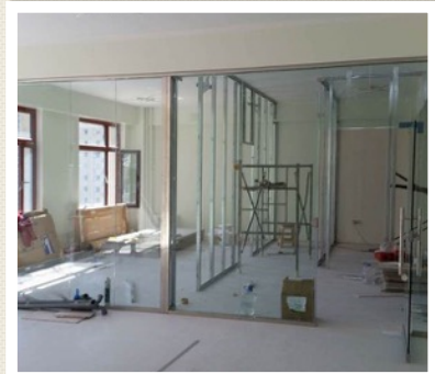
BLESSING CARE COSMETIC CLINIC도 개원준비중입니다.