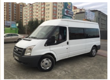
귀한 동역자의 헌신으로 병원 버스를 구입하였습니다.