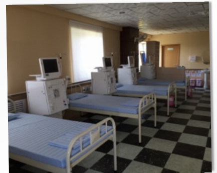
8월 25일부터 처음으로 혈액투석을 시작하려고 준비중입니다.