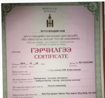
병원 허가증 입니다.

니다. 외래를 시작하기 위해 외래 진료실을 손보았고, 엑스레이 시설과 영상 전달장치도 완비되어 외래를 위한 준비를 하나 하나 진행하였습니다. 가장 먼저 고대 영상의학과 팀과 함께 선교사님들 검진과 진료를 진행함으로써 외래를 위한 시뮬레이션을 시행하였습니다. 8월 25일부터는 첫 투석을 시행하게 됩니다. 혈액투석이 상당히 예민하