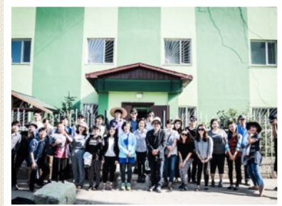
첫번째 여름사역을 아가페 병원에서 마치고나서