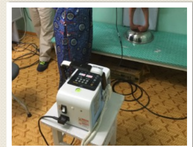
DK 메디칼에서 데모해 주신 포터블 엑스레이로 한단계 올라선 의료봉사를 할수 있었습니다